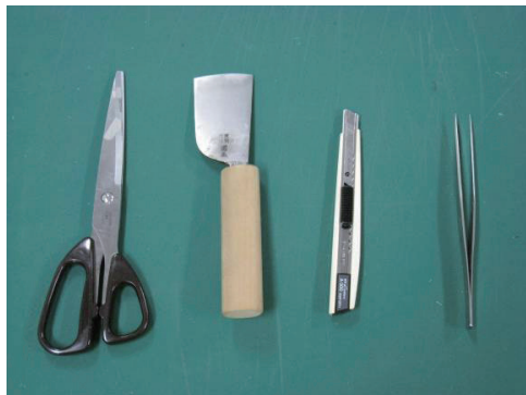
[左から]鋏、皮削包丁、カッター、ピンセット このほか、丸包丁もよく使う。