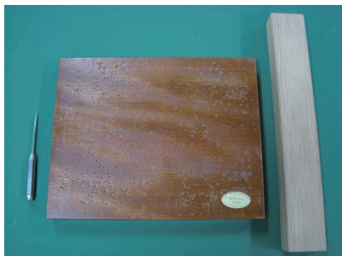
[左から]目打(星突)、目打ち台、樫矢