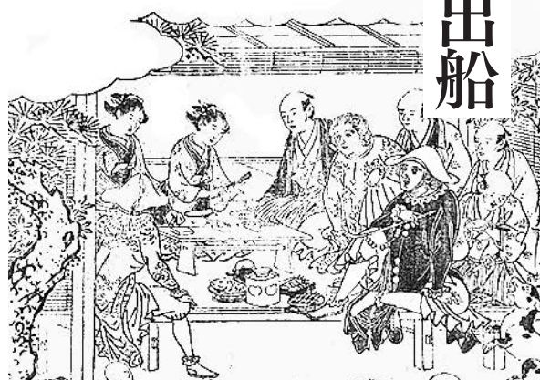
「二軒茶屋」 〔拾遺都名所図会〕より 国立国会図書館蔵