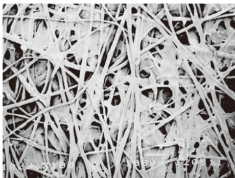
美濃紙の電子顕微鏡写真

古文書・古典籍・絵画など、日本には「紙」の文化財が数多く残されている。これらの料紙には、どのような材料が使用され、どのような漉き方、加工が施されたのか。また、色や大きさを選定する背景には、どのような価値観があったのか——紙はその当時の人びとの心性や文化体系をいまに伝える貴重な史料である。それらの文化財を守り、伝えていくためには、 基盤となる紙の調査・分析を欠くことができない。 四十数年に及び、先駆的に紙の文化財の調査・科学的分析に関わり、料紙の材料や構造・製法の研究において、数多くの実績を残し、修理用紙の作成、料紙の復元などにも尽力してきた著者の知見を初めて集成。現在、大きな展開を見せている「紙」の研究の基盤と歩みを提示する画期的な一冊。