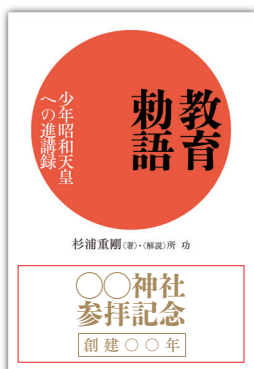
カバー表 名入れ例(帯なし)