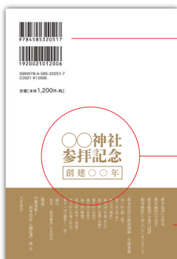
カバー裏 名入れ例(帯あり・価格表記あり)

バーコードや本の価格情報を外したのもご用意可能ですので、販売価格は自由に設定いただけます